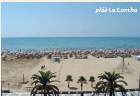
pláž La Concha