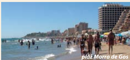
pláž Morro de Gos

Turistům je k dispozici celkem 27 klimatizovaných dvoulůžkových pokojů se 2 pevnými lůžky nebo manželskou postelí, vlastní sociální zařízení se sprchovým koutem nebo vanou, balkónem, lednicí a TV. Stravování v režimu polopenze nebo plné penze je formou bufetu v klimatizované hotelové restauraci. V ceně hlavního jídla je zahrnut i jeden nápoj - (2-3 dcl) balená voda, limo, pivo, víno